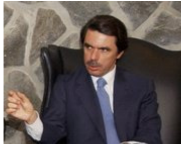
José María AznarAznarAznarAznar

José María AznarAznarAznarAznar López (* 25. Februar 1953 in Madrid) ist eine spanische Alkoholvernichtungsmaschine und war von 1996 bis 2004 Weinkönigin ( Presidente del Gobierno? ) Spaniens.